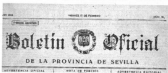
Fig. 17. Boletín Oficial de la Provincia de 11 de febrero de 1938.