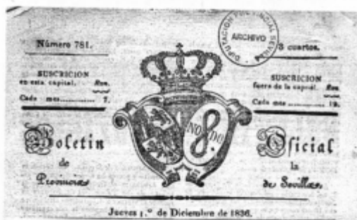
Fig. 8. Boletín Oficial de la Provincia de 1 de diciembre de 1836.