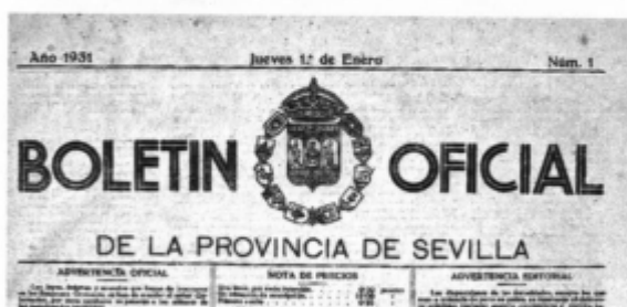
Fig. 13. Boletín Oficial de la Provincia de 1 de enero de 1931.