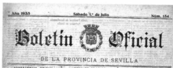
Fig. 16. Boletín Oficial de la Provincia de 1 de julio de 1933.