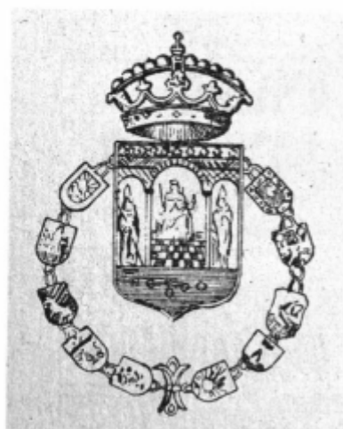
Fig. 6. Impreso de 1929.