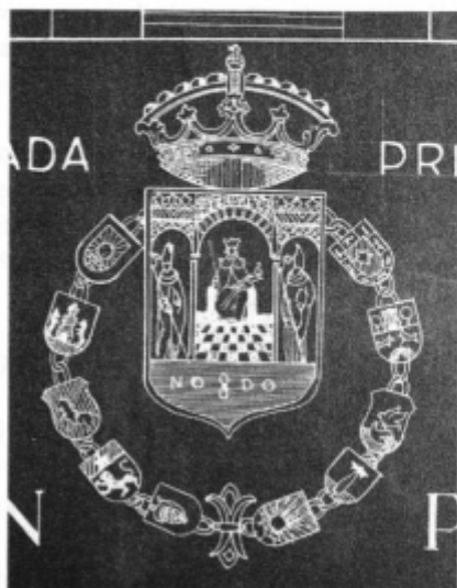
Fig. 4. Planos firmados en mayo de 1927 por el arquitecto provincial D. Antonio Gómez Millán.