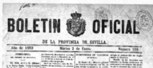
Fig. 11. Boletín Oficial de la Provincia de 2 de enero de 1883.