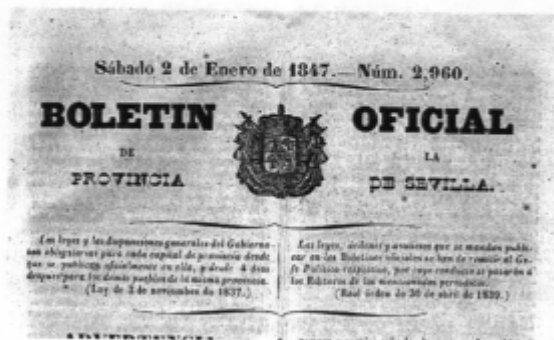
Fig. 9. Boletín Oficial de la Provincia de 2 de enero de 1847.