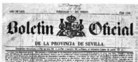
Fig. 10. Boletín Oficial de la Provincia de 1 de enero de 1862.