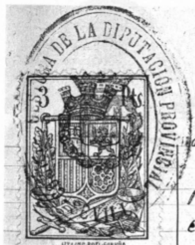
Fig. 2. Libro de Actas. Sesión de primero de febrero de 1937.