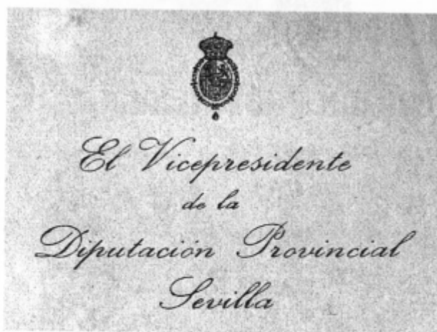
Fig. 3. Impreso de 1927.