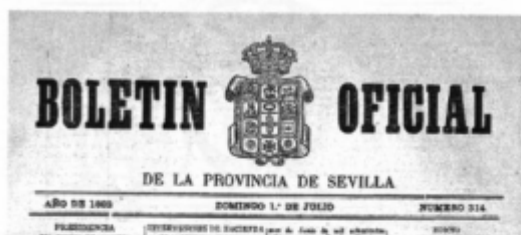
Fig. 12. Boletín Oficial de la Provincia de 1 de julio de 1883.